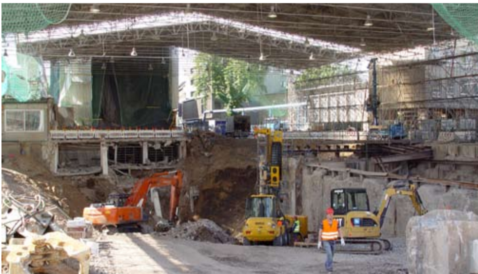
Die Einsturzstelle des Kölner Stadtarchivs