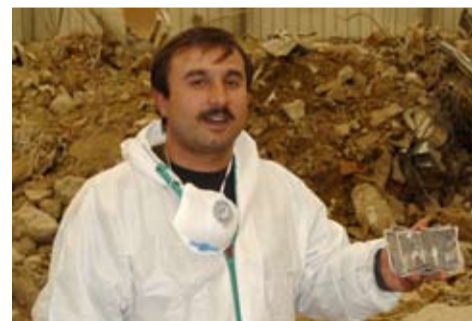
Fleißiger Mitarbeiter der Stadt Köln mit historischen Fotos