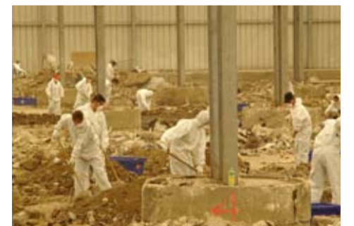
Fleißige Helfer der Stadt Köln suchen im Schutt nach wertvollen Dokumenten