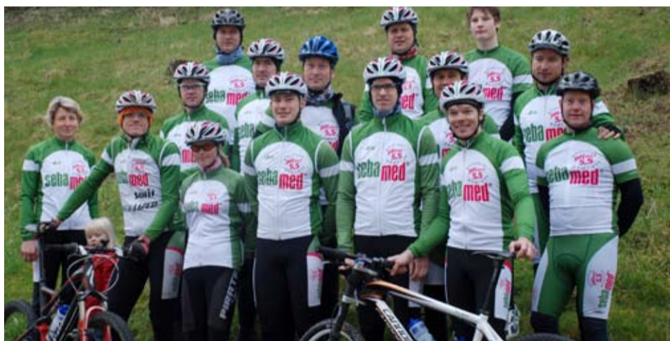
Das MTB-Team von Sebapharma beim Cross Country und Marathon-Rennen