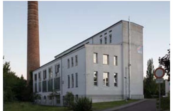
Der Sicherheitsbereich in einem ehemaligen Kraftwerk bietet unserer AlarmEmpfangsStelle optimalen Schutz.