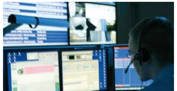
Spezialisten überwachen und bearbeiten täglich bis zu 800 Alarm-Meldungen.